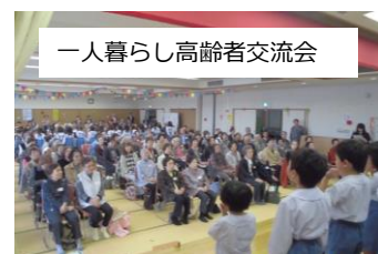
一人暮らし高齢者交流会