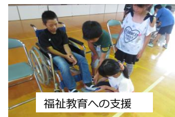
福祉教育への支援