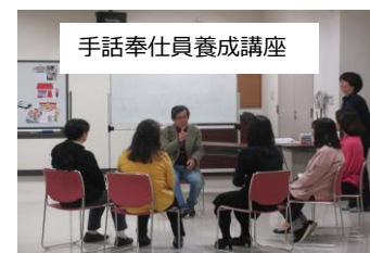
手話奉仕員養成講座