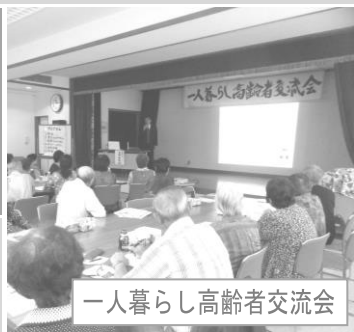
一人暮らし高齢者交流会