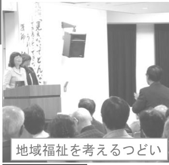
地域福祉を考えるつどい