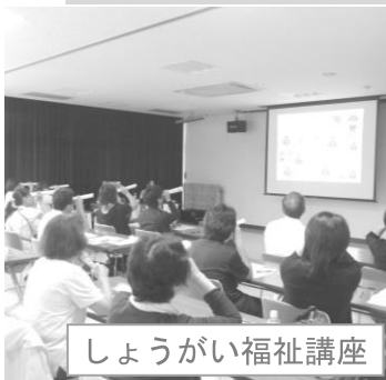
しょうがい福祉講座

児童青少年福祉のために ・団体助成（ひとり親家庭福祉会、少年補導員会） 250,000円